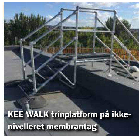
KEE WALK trinplatform på ikke-nivelleret membrantag