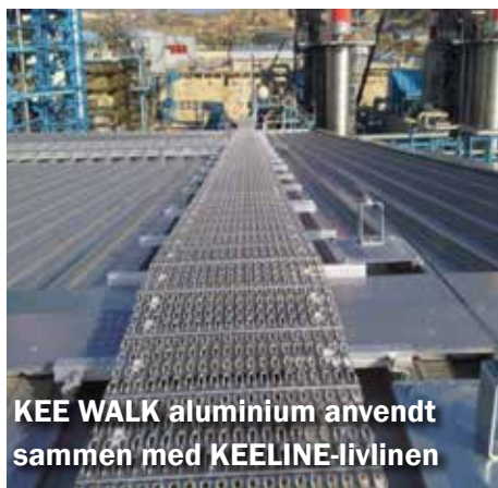
KEE WALK aluminium anvendt sammen med KEELINE-livlinen

Kan bruges sammen med andre produkter til at udgøre en komplet faldsikringsplan.